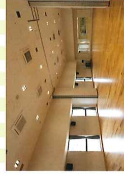
▲雨天時は当施設の多目的スタジオで実施